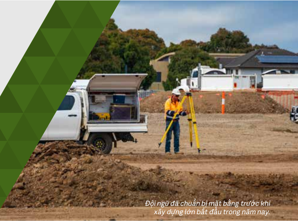
Đội ngũ đã chuẩn bị mặt bằng trước khi xây dựng lớn bắt đầu trong năm nay.