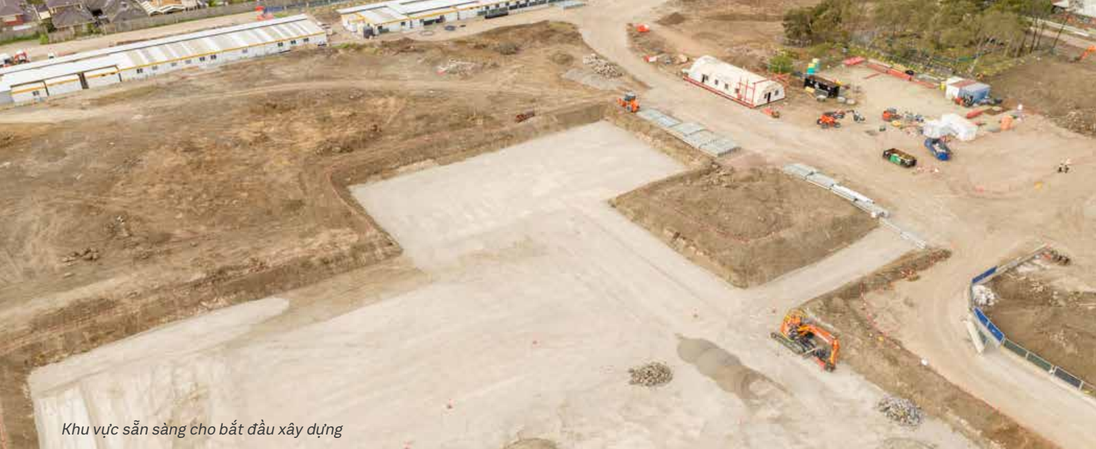
Khu vực sẵn sàng cho bắt đầu xây dựng